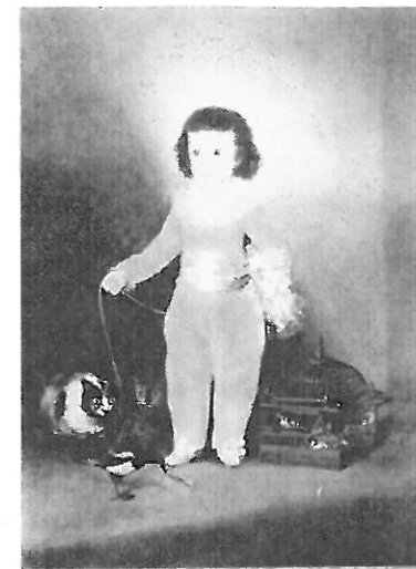
"Don Manuel Osorio Manrique de Zuñiga" (1788)

Oil on canvas, 327 x 101. Metropolitan Museum of Art, New York, USA